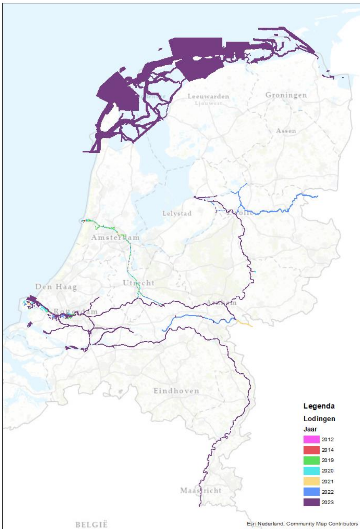
Figuur 1 De door lodingsmaatregelen aangepaste bodemhoogte in baseline-nl_land-j24_6-v1 en van welk jaar de laatste lodingen zijn.