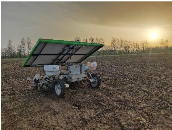
Foto: FarmDroid FD20 in het veld met open zonnepaneel (niet in de operationele modus)