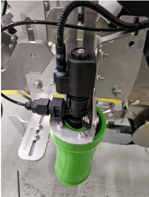
Foto: Montage van pulserende spuitdop met flexibele windscherm/afscherming op de FarmDroid spotsprayer