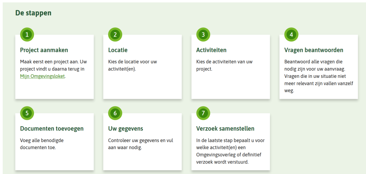
Figuur 1 Stappen in Opstellen

Bij het opstellen van een verzoek in de Landelijke Voorziening worden verschillende stappen doorlopen (zie Figuur 1). Voor de initiatiefnemer is het niet zichtbaar uit welke bron de vragen komen (algemene set, toepasbare regels van activiteiten). De algemene set wordt op diverse plaatsen uitgevraagd: projectgegevens in “Project”, zie Figuur 2, algemene- en adresgegevens initiatiefnemer in “Uw gegevens”, zie Figuur 3 en akkoordverklaring in “Verzoek samenstellen”, zie Figuur 4. In stap “vragen beantwoorden” en “Documenten toevoegen” worden de toepasbare regels van de geselecteerde Activiteiten beantwoord.