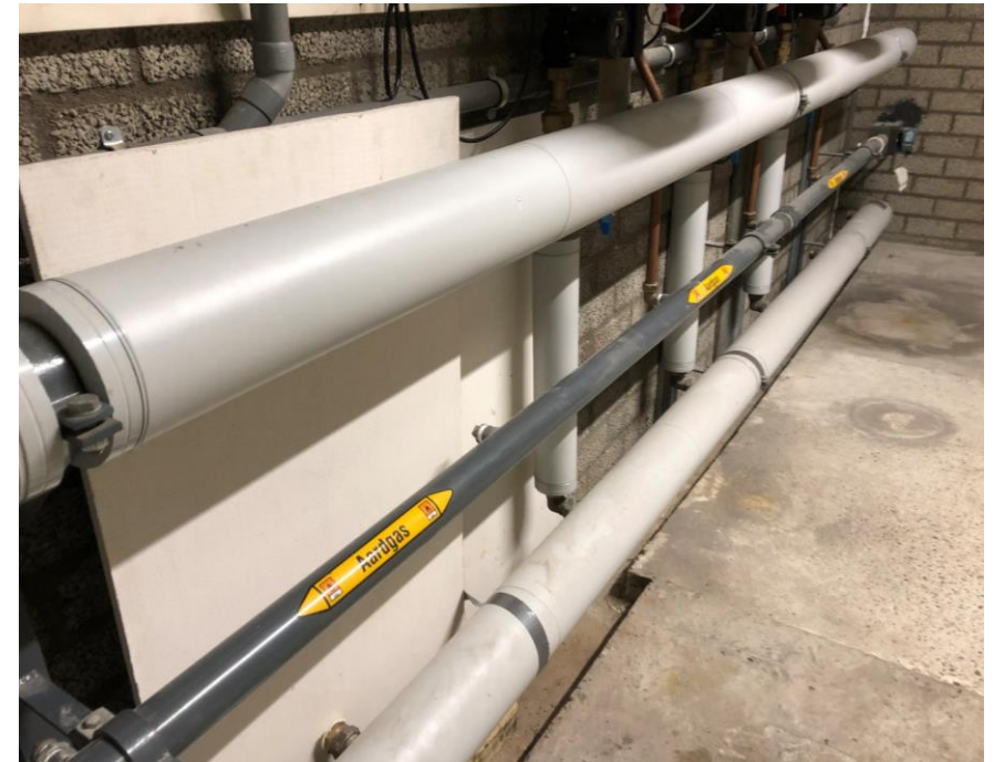
GC2a - Isolatie aanbrengen om leidingen en appendages