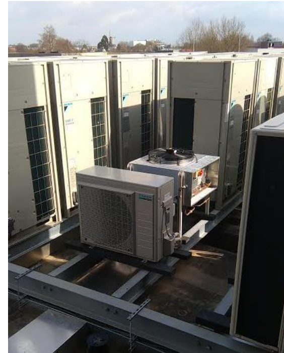
Buiten unit van een Lucht-Water Warmtepomp