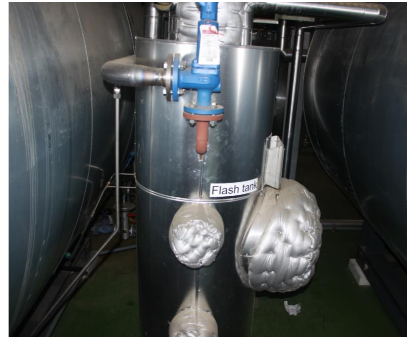
FD2b-Ontspanningsvat toepassen waarin condensaat in druk wordt verlaagd om vervolgens nuttig toe te passen