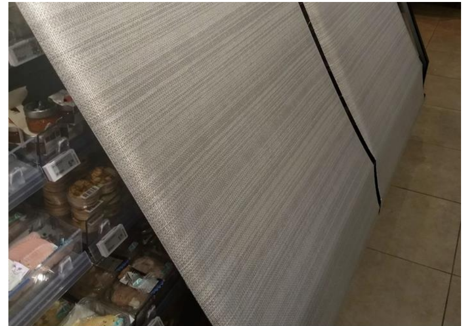
Detailhandel, FB2a - Nachtafdekking toepassen