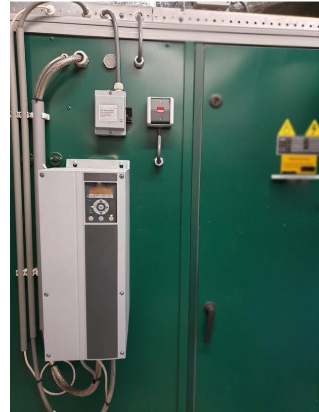
GB1a - Frequentie gestuurde afzuigventilator op basis van het benodigde debiet