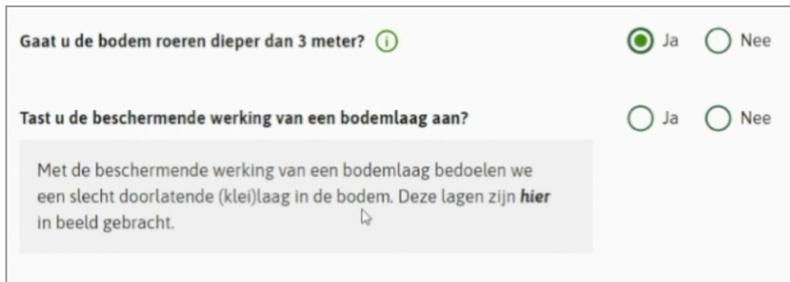
Maximale boordiepten i.v.m. de aanwezigheid van een bodemlaag met beschermende werking

Het aflezen van de bedoelde informatie is niet vanzelfsprekend.