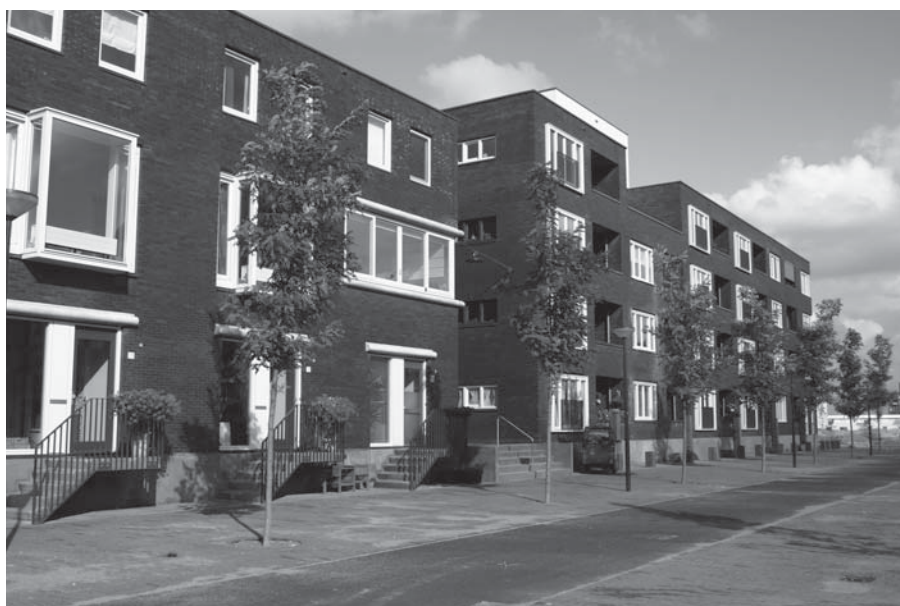
WOONGEBIED MET KLEINE, GROTENDEELS VERHARDE, TUINEN