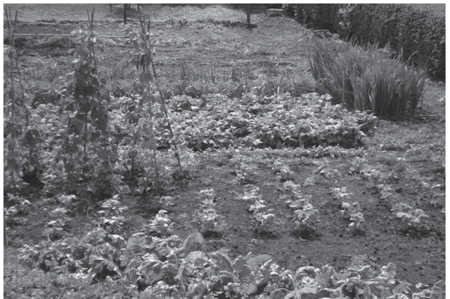
MOESTUINEN EN VOLKSTUINEN MET VEEL GEWASCONSUMPTIE

bouwen. De gemeente kan rekening houden met de lokale biobeschikbaarheid van stoffen of de verantwoording nemen voor een hoger of een lager beschermingsni-